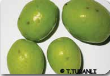
Zeytin Sineği ergin çıkış deliği