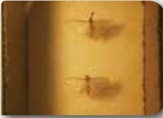
Zeytin Fidan tırtılı ergini