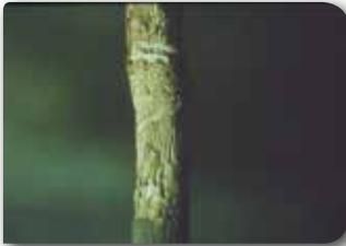
Zeytin filiz kiran zararı