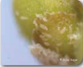
Acerian oleae ergini

( Aceria oleae (Nalepa) ve Aculus olearius (Castagnoli)) (Acarina: Eriophyidae)