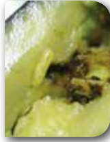
Zeytin Sineği Larvası

velerin çürüyerek dökülmesine, zeytinyağı miktarının azalmasına kısmen de yağda asitliğin yükselmesine neden olur. Özellikle sofralık zeytinlerde zararı daha büyük önem taşımaktadır.