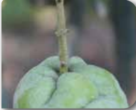
Yaprak ve çiçekteki belirtileri