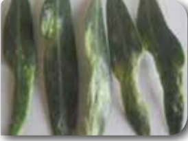
Yapraklarda oluşan bozulmalar