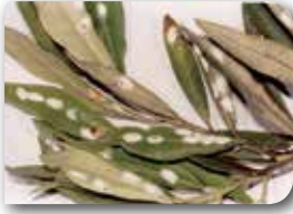
Zeytin pamuklu koşnili ergini