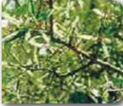
Zeytin yara koşnili'nin zararı