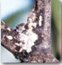
Zeytin yara koşnili