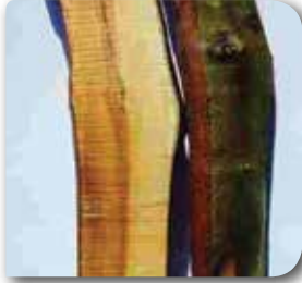
Ağaçtan bir kesit