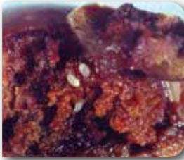
Zeytin kızılkurdu yumurtası