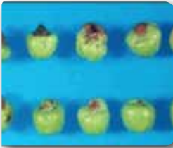
Maymun yüzü meyve oluşumu

mu artar. Ağaçlarda bodurlaşma ve çalılışma görülür.