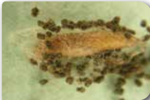
Zeytin güvesi pupası

Zeytin güvesinin meyvelerdeki zarar oranı yıllara ve bölgelere göre değişir. Bazı yıllarda bu zarar %30'a kadar ulaşan ürün kaybına neden olabilmektedir.