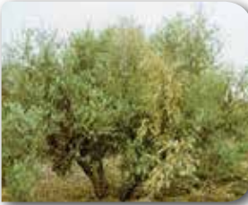
Ağacın genel görünüşü