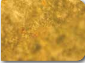
Aculus olearius ergini