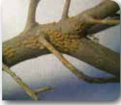
Zeytin kırlangıç böceği yumurta paketi