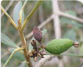
Erken dönem meyve zararı