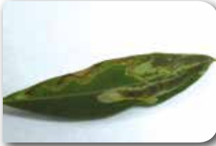
Güvenin yapraktaki zararı

Meyve dölü zararı: Yumurtadan yeni çıkan larvalar meyvenin içine meyve sapı dibinden girerek meyve ile meyve sapının birleştiği kısmı tahrip eder ve bu meyvelerin dökülmelerine neden olur.