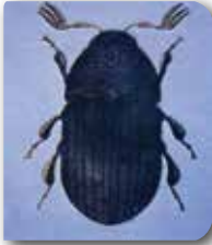
Zeytin filiz kiran ergini