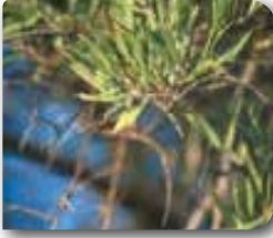
Yapraklarda rozetleşme durumu