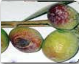
Zarar görmüş zeytin meyveleri