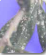
Zeytin kabuklu bitinin sürgün ve yapraktaki zararı