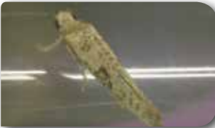
Zeytin güvesi ergini

• Pupa dıştan görülebilen seyrek dokulu beyaz bir kokon içinde bulunur.