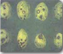
Zeitin kurdunun meyvedeki zararı