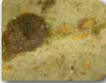
Zeytin karakoşnili'nin dişileri