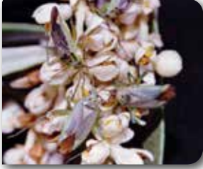
Zeytin çiçek sap sokanı ergini ve zarar şekli