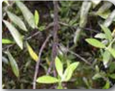
Zeytin karakoşnili'nin yumurtaları ve birinci dönem larvaları