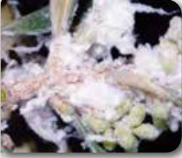
Zeytin pamuklubiti ergin ve nimfi