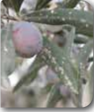
Zeytin kabuklu bitinin meyvedeki zararı