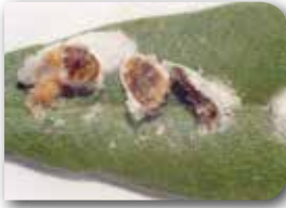
Zeytin pamuklu koşnili yumurtaları