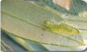
Zeytin güvesi larvası